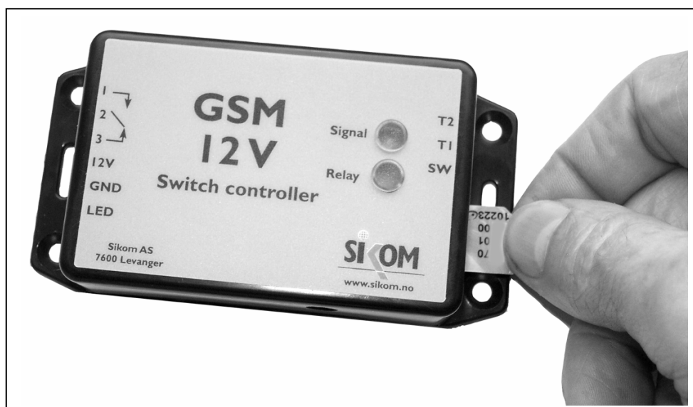
Figur 1: Korrekt innsetting av SIM-kort

SIM-kortet føres inn i GSM 12V med gullkontaktene vendt ned og det kuttede hjørnet vendt ut. Se figur 1.